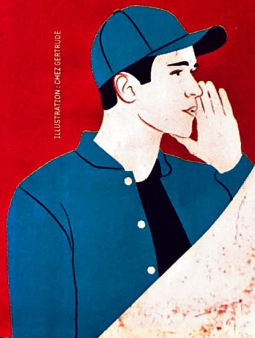
ILLUSTRATION : CHEZ GERTRUDE