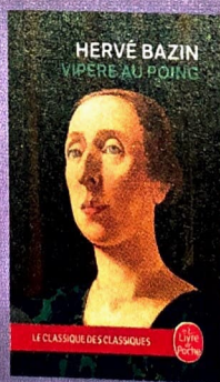
Vipère au poing (1948), un roman d'Hervé Bazin.