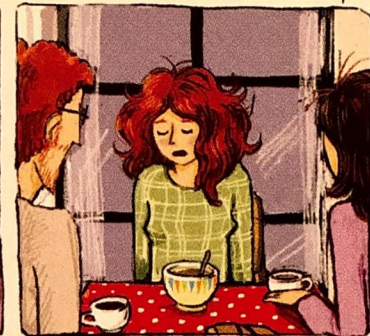
Je ne voulais plus regarder. À force de pleurer, d'avoir des bleus à l'âme, à force d'avoir chaque matin la trouille de me lever, de les affronter, je suis tombée malade.