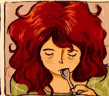
Papa et maman ont pensé : chacun d'amour. Je ne voulais pas leur dire. J'avais trop honte. J'avais trop mal.